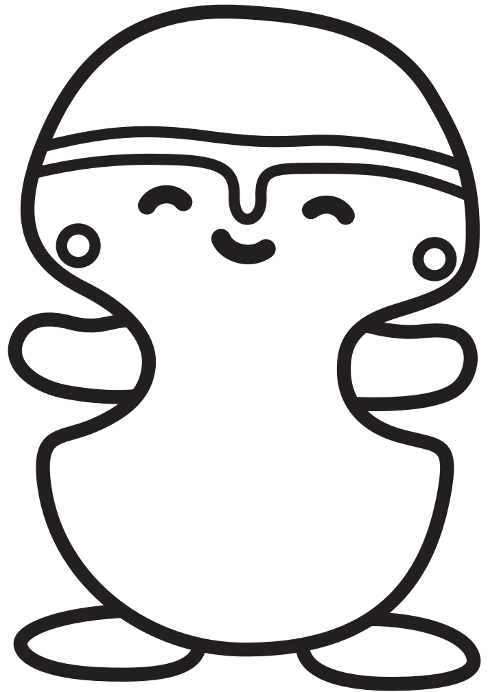
松山市考古館キャラクター『ふんどう君』